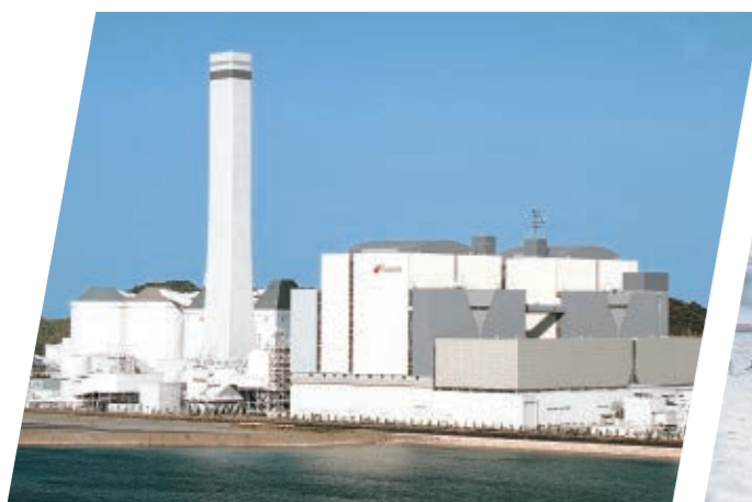
橋湾火力発電所(徳島県)