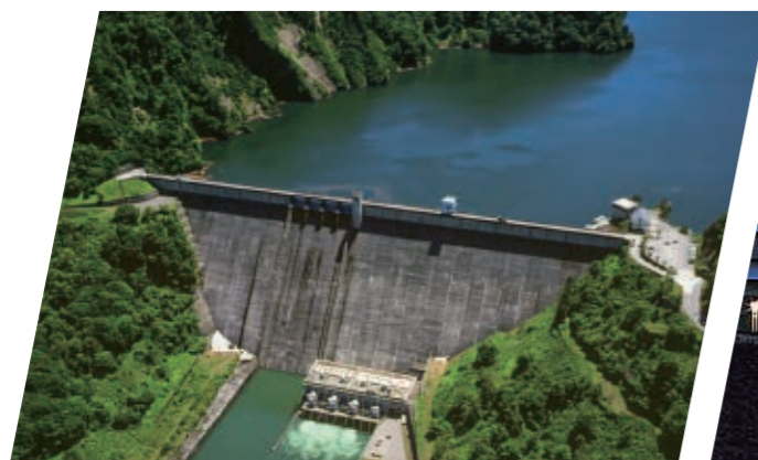
田子倉発電所・ダム(福島県)