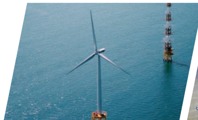
響灘洋上風力発電施設(福島県)