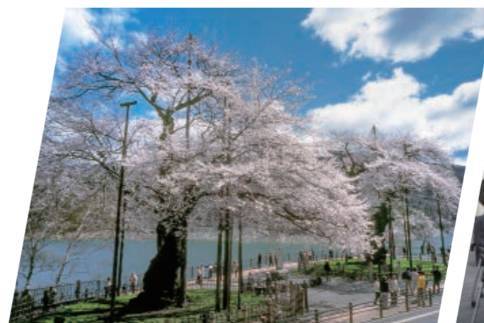
荘川桜(御母衣ダム/岐阜県)