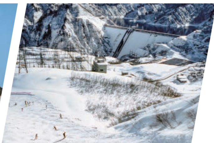
奥只見ダム(新潟県・福島県)