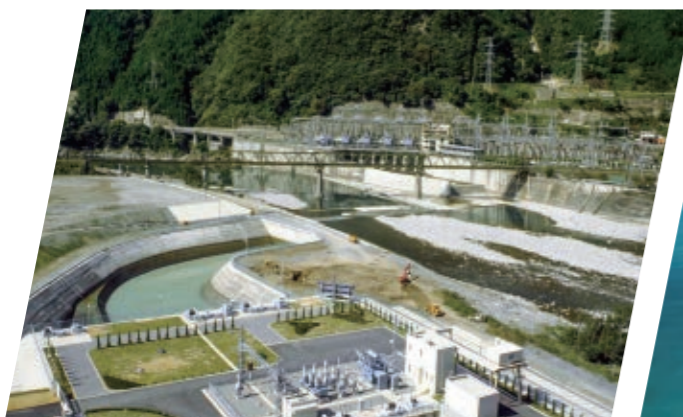
佐久間・佐久間第二発電所(静岡県)