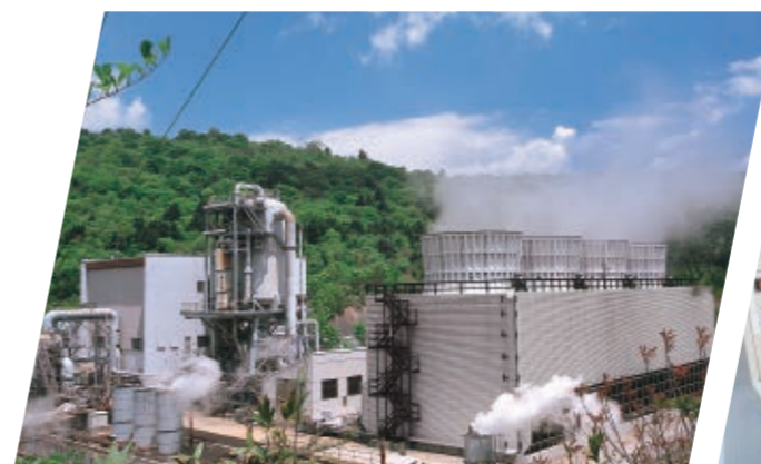
鬼首地熱発電所(リニューアル工事中/宮城県)