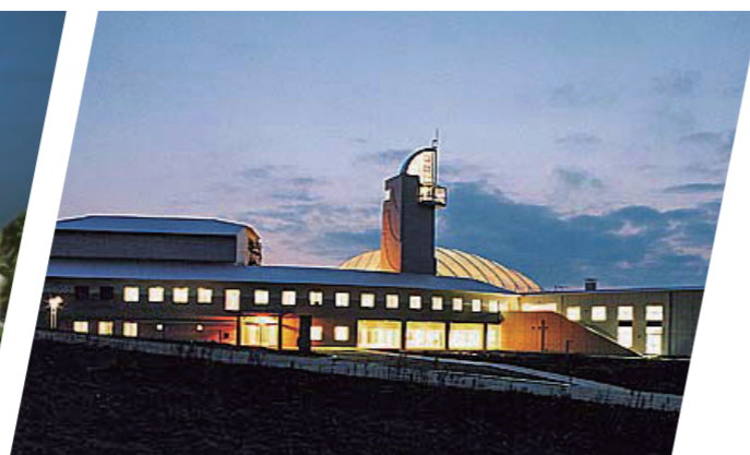
総合文化センター「ウイング」(青森県)