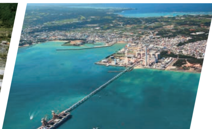
石川石炭火力発電所(沖縄県)