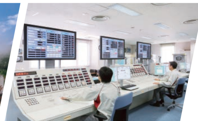
ダムシミュレータ(J-POWER茅ヶ崎研究所構内/神奈川県)